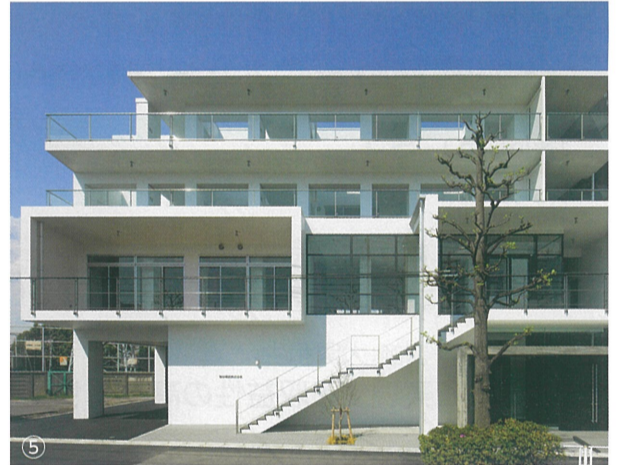
①② 設計:添田貴之 / ③ 設計:山本健太郎 / ④ 設計:添田貴之 / ⑤ 設計:山本健太郎