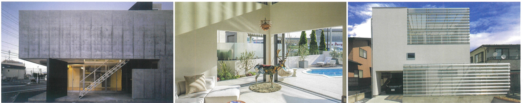
使用写真(左から) / 設計:河野有悟 / 設計:池田佳人 / 設計:小島広行