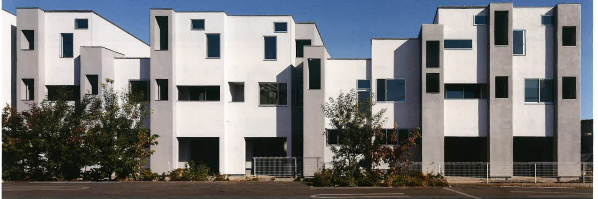
設計:河野有悟

～土地活用・収益物件・自宅併用マンションなど～ 木造・鉄骨・RC造・戸建て住宅より収益物件まで事例紹介