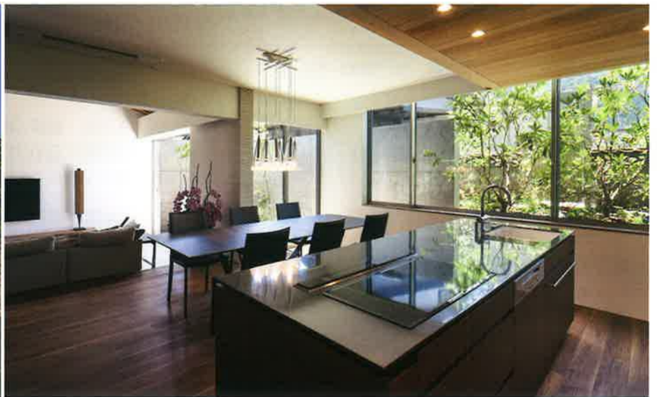
設計:岸研一