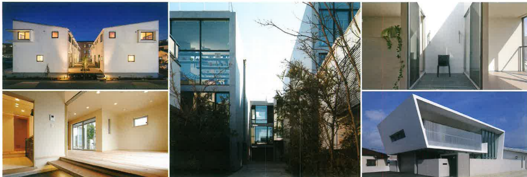
使用写真／(左上)設計:岡田勲／(左下)設計:倉島和弥／(中央)設計:相原まどか 撮影:傍島利浩／(右上)設計:佐藤千恵 撮影:後藤武／(右下)設計:森裕 撮影:岡本公二(Techni Staff)