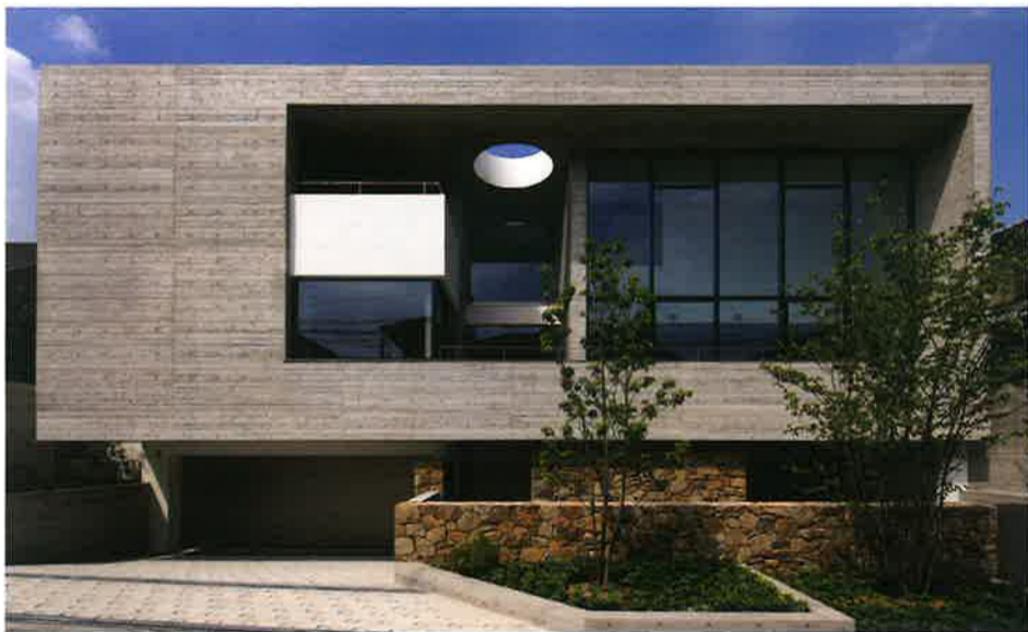
設計:澤村昌彦

～土地活用・収益物件・自宅併用マンションなど～ 木造・鉄骨・RC造・戸建て住宅より収益物件まで事例紹介