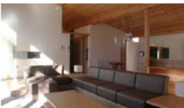
写真写真(左から) 設計: 池田住人 撮影: 斎藤一平/設計: 中尾英己/設計: 大澤和生